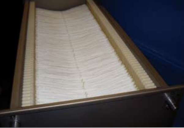
Мембранный модуль SUR 334 LB