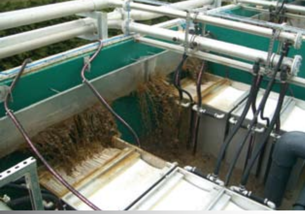
РЕКА KROEF, крупнейшие в Нидерландах сооружения для очистки промышленных сточных вод с помощью МБР производительностью 2,880 м 3 /сутки